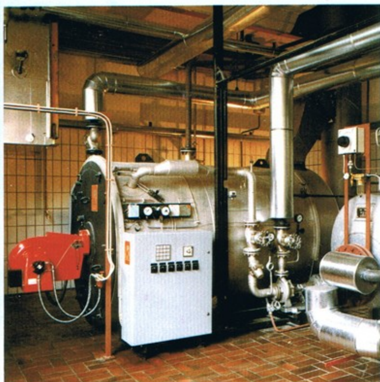
Hilfskessel / donkey boiler

High Reliability under the most severe Service Conditions